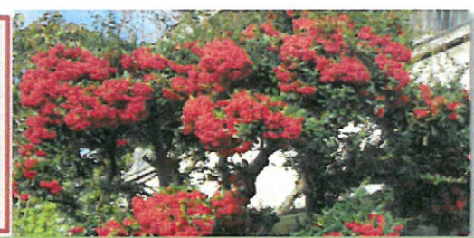
右は、 色鮮やか ピラカンサス 左は、 11月1日の朝 雨がやみ 香風園から見える朝霧